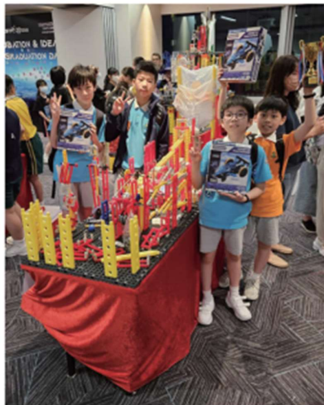
2023香港機關王競賽 最具創意獎

關於校外比賽，我們學校在不同領域中都有取得優異成績。在 CoolThink 全港小學生運算思維比賽 2023 中，我們的五年級和六年級 App Inventor 隊伍成功進入決賽，比賽將於 2023 年 7 月 15 日在香港教育大學舉行。屆時，我們的兩隊代表將向評判介紹參賽作品的設計理念和運作方式。此外，在第二屆學習與生活短片比賽中，我們取得了 4 個一等獎、2 個二等獎和 3 個三等獎。在由 AiTLE 資訊科技教育領袖協會舉辦的「STEM × 海洋航行器設計及建造比賽」中，我們的小學組獲得了設計大獎冠軍、亞軍和最佳功能獎。此外，我們也參加了第一屆香港機關王競賽，在眾多參賽隊伍中脫穎而出，贏得了最具創意獎。這些優異成績反映了我們學校在不同領域中的實力和創造力，以及學生們的卓越表現和努力付出。我們將繼續支持學生參加不同的比賽和活動，鼓勵他們發揮創意和專業知識，並且不斷追求卓越。