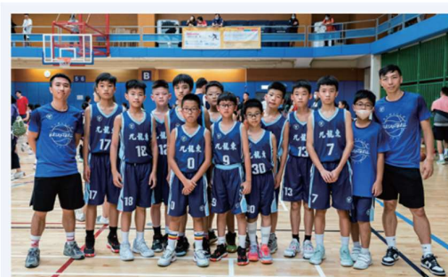
九龍東區學界籃球比賽 – 男子冠軍