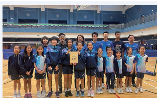
九龍東區學界羽毛球- 男子冠軍、女子亞軍