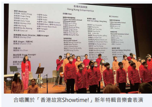
合唱團於「香港故宮Showtime!」新年特輯音樂會表演