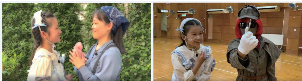
愛回校之愛麗斯笑遊福附

「愛麗斯笑遊福附」品德教育短片透過戲劇的方式，生動形象地呈現了樂觀感、價值感和歸屬感的重要性，並且結合學生的實際情境，引導他們在成長的過程中，建立健康積極的心理和價值觀。