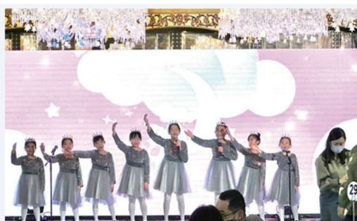
FSSAS singers performing in a Charity show