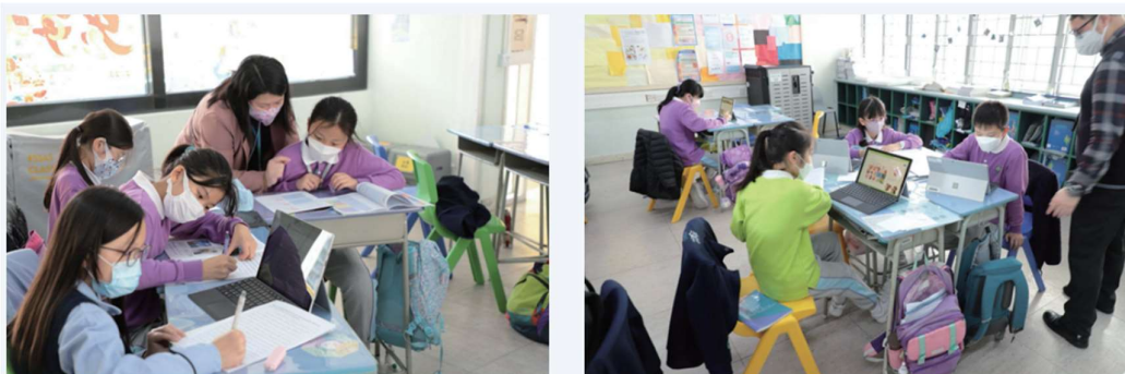
學生正進行「福附研究院」課程

學校自 2 月 6 日起開始進行全日面授課。下午時段主要為「體藝及個人成長自主學習時段」和周會活動。在「體藝及個人成長自主學習時段」中，學生可以參加不同的學習體驗活動或參加拔尖補底學術支援班。未參加上述活動的學生可以參加全新的課程「福附研究院」，並使用老師預先設計的多元化教材（包括短片、簡報表、學習指引、腦圖、學習材料包等），內容涵蓋語言學院、體育學院、藝術學院、科技學院、經濟學院和生活學院等六大範疇。學生更有機會參加由校內外團體舉辦的活動，進行個人或小組學習，幫助學生成長、深化自主學習和豐富校園體驗。