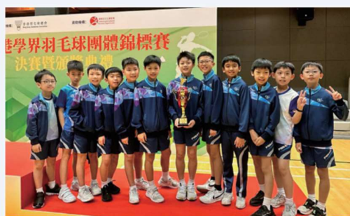
全港學界羽毛球團體錦標賽 – 男子季軍