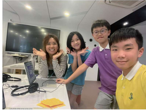
English debate enters the Final

This year, many P4-P6 students joined debate for the first time. Despite this, Team 1 developed impressive public speaking skills and Team 2 remains undefeated. Their passion and dedication to research and critical thinking will make them highly successful in other endeavors. They have gone against top-tier schools and have been recognised as the Best Speakers in many competitions.