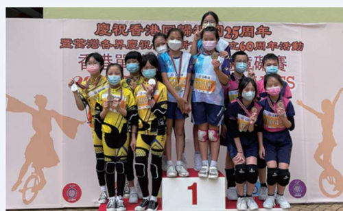
2022 單輪車比賽花式賽暨障礙賽 - 全場總冠軍