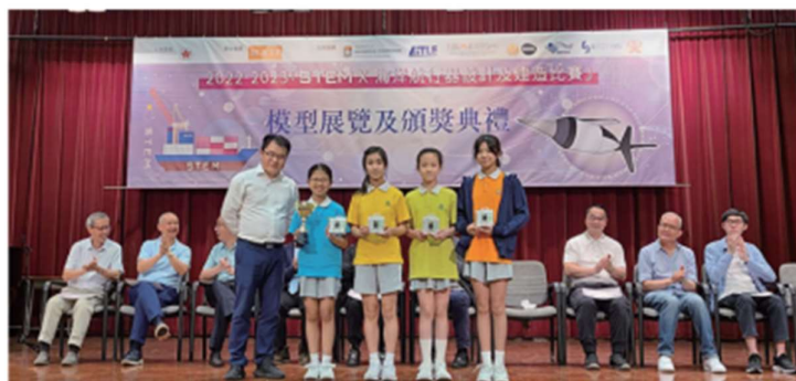
2022 - 2023 「STEM×海洋航行器設計及建造比賽」 中：海洋航行器設計大獎 小學組 冠軍 海洋航行器建 造大獎 小學組 亞軍 最佳功能獎亞軍