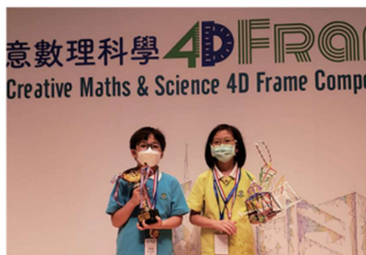
2022 16th International Mathematical Science and Creativity Competition - Champion

在 AMO 決賽中，18 名由小二至小六的學生共取得 3 金、6 銀、6 銅及 3 優異的成績。