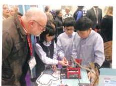
四位同學積極參與英語，展示他們以編程設計的得獎作品「IoT 智能監察器」。