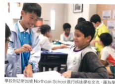
學校與北約克區 North York School 進行姊妹學校交流，讓為學生上課情況。