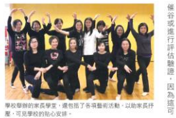
學校舉辦的家長學堂，包括了各項藝術活動，以助家長培養，可見學校的精心安排。

這七個習慣，除了能培養社交技巧與自給能力外，另一大重點是管理自己的生活和時間。「雖然我們鼓勵學生參與活動，但也必須備學生的份內事，就